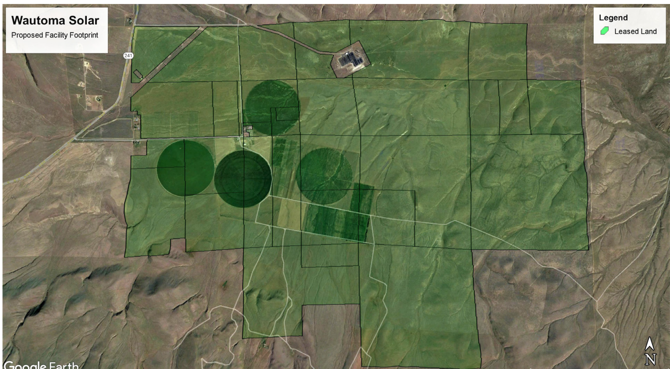
Figura 1. Las áreas resaltadas en verde representan terrenos que Innergex actualmente tiene en arrendamiento para el proyecto Wautoma Solar.