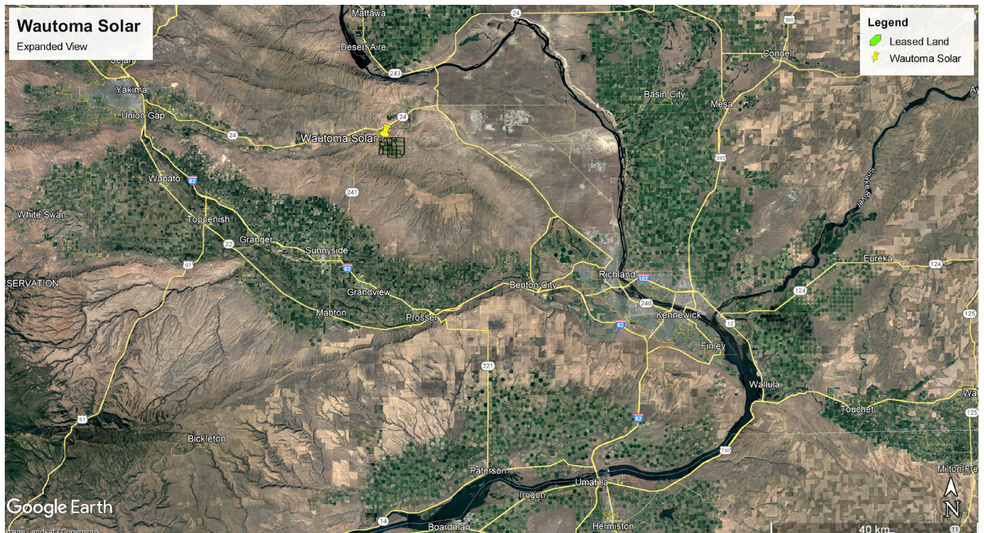
Figura 2. Vista ampliada. El proyecto Wautoma Solar se encuentra en la esquina noroeste la del Condado de Benton.

Ellen Bird , Gerente de Relaciones comunitarias y gubernamentales ( ebird@innergex.com o 778-689-6023)